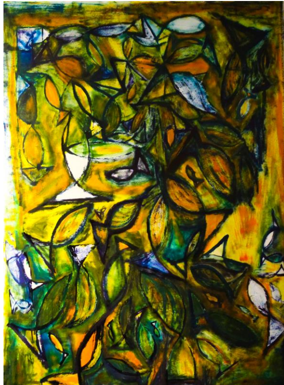
Schools of fish with coffee cup and egg, 2021

I started drawing in the classical style around age 7, started taking University drawing classes at age 8. I am an Abstract Expressionist. I am also a master printer and bookbinder by trade. I have been in the printing trade as a master journeyman since the age of 20. At my studio I teach classes in creative thinking also. I utilize recycled materials from the printing industry and manufacturing facilities, that are out dated and bring them back to life as art.